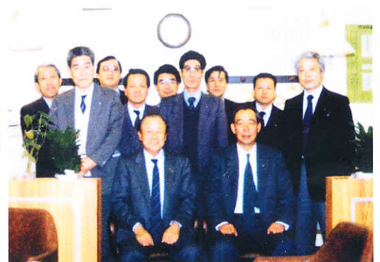
H2年2月27日麻雀同好会