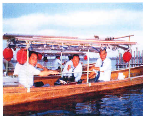
昭和62年8月4日「近江八幡水郷めぐり」納涼例会