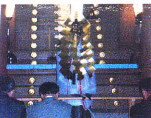
1/5新年例会 多賀大社にて