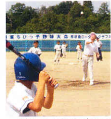
第21回彦根南R杯湖東ちびっこ野球大会