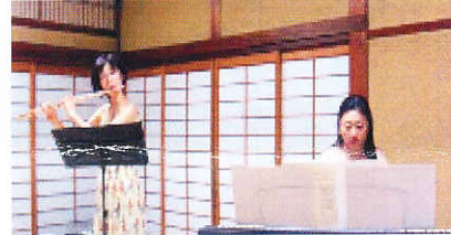
9/29月見例会 竹平楼 フルートとピアノのタベ