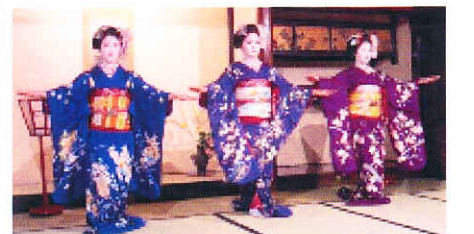
親睦旅行 一力にて