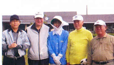
10/27職場訪問例会 彦根CC