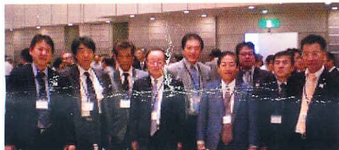
9/5 I Mに参加して 大津プリンスホテル