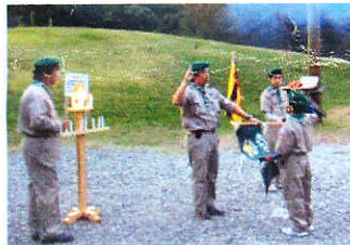
10/24ボーイスカウト上進式