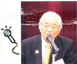
9/1ガバナー公式訪問