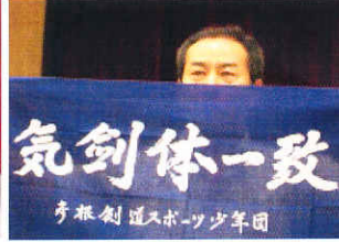
青少年育成期金を いただいて