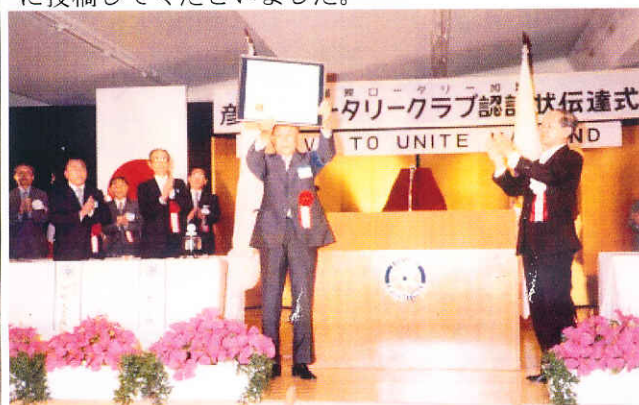
昭和53年6月15日 ロータリークラブ認証状伝達式 場所 エースレーン