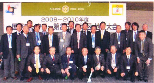
4/4地区大会に参加 国立京都国際会館