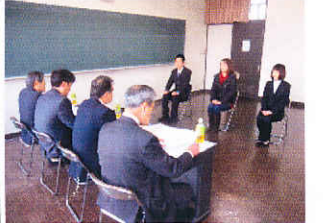
3/17 聖泉大学 模擬面接