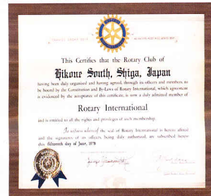
夏原君が掲げているのは彦根南RCの 認証状です