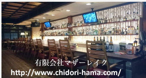
有限会社マザーレイク http://www.chidori-hama.com/