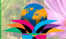
世界へのプレゼントになろう

事務局 : 〒522-0043 滋賀県彦根市小泉町160-4 : TEL 0749-23-2102 / FAX 0749-23-2108 U R L : http://hikoneminami-rc.com E-mail : minamirc@oregano.ocn.ne.jp 第2650地区Web : http://rid2650.gr.jp