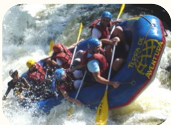
激流を下るラフティング (ブラジル)

これからの日本は少子高齢化による人口減少で縮小社会に突入していきます。また、世界では地政学的リスクも高まり、小さな地球の中なのに「喰うか喰われるか」の緊張が高まっていくでしょう。まさに「激流」と言える世の中で、私たちは会社を守り、従業員とそこご家族を守り、さらには職業を通じて社会に奉仕していかなければなりません。